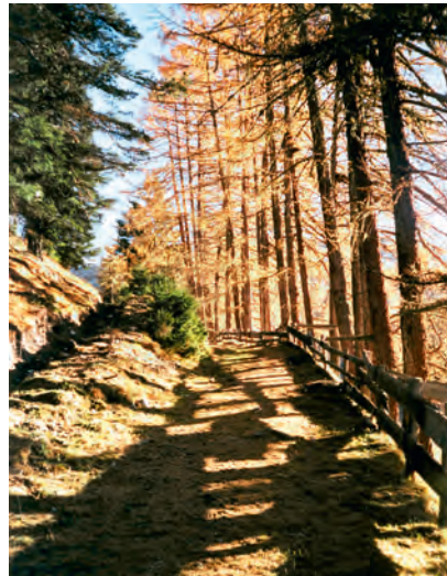
Bild links: Scholbergweg (Scala-Weg) nördlich Sargans. Seit dem 14. Jahrhundert nachgewiesener Umgehungs-Transitweg: Wartau-Ober-Trübbach-Sargans.