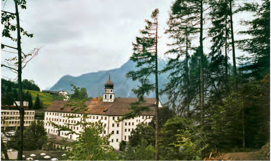
Ehemaliges Kloster Pfäfers, das Zentrum der frühmittelalterlichen churrätischen Schriftkultur.

Churer Rheintal und im Vorderrheintal; zudem besass es in Splügen, am Ausgangspunkt zum Splügen- und Bernhardinpass, eine Klosterzelle samt umfangreichem Wies- und Ackerland und einer Alp, und ebenso bei Casaccia im Bergell das Kirchlein San Gaudenzio. 3 Der Pfäferser Besitz südlich des Alpenkammes wird 1116 mit der Kirche San Gaudenzio am Fusse des Septimerberges bestätigt, und zudem werden gleichzeitig Besitzungen in Chiavenna genannt. Pfäfers unterhielt also im 9. Jahrhundert wichtige Stützpunkte an den Haupttransversalen Nord-Süd und stützte damit die Alpenpasspolitik der deutschen Könige und Kaiser; ein Teil des transitierenden Verkehrs ging dabei zweifellos über den Kunkelsweg.