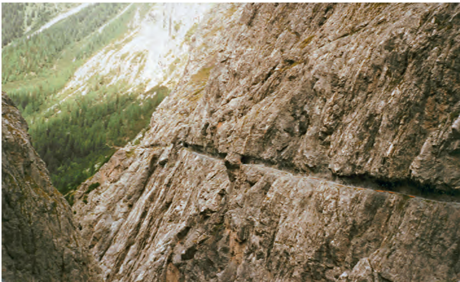
Im Felsen eingehauenes Wegstück in der Val d'Uina (Sent - Pass da Schlingia) am S-chalambert.