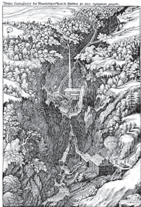
Bild links: Kunkelsspass-Übergang und -alp heute. Bild rechts: Bad Pfäfers in der Taminaschlucht im 17. Jahrhundert. Küng-Dormann. Vom Walensee ins churrätische Hochland. Chur 1897, S. 14.