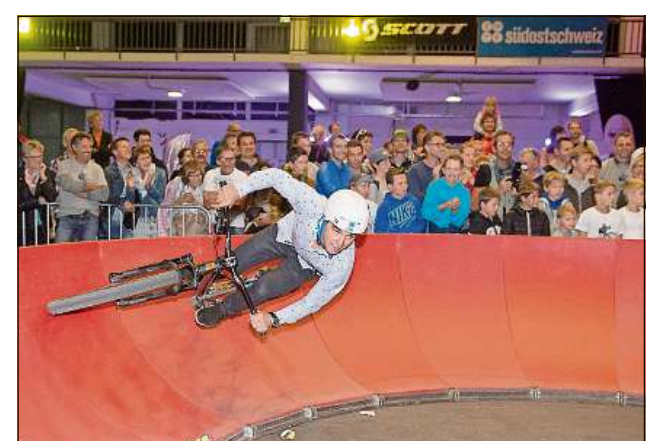
Nino Schurter ha era testà la «pumptrack» e demonstrà sias abilitads sco biker.