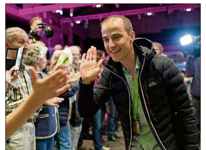
Il bainvegni en la halla da la citad è stà fitg cordial.