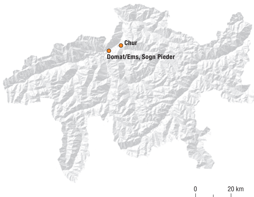
Abb. 1: Tomils, Sogn Murezi. Die Fundstelle Sogn Murezi liegt im bündnerischen Dorf Tomils in der Talschaft Domleschg.

Die abgegangene Kirchenanlage befindet sich in Hanglage am nordöstlichen Dorfrand von Tomils auf der Parzelle 449 der Flur Sogn Murezi (Hl. Mauritius) Abb. 2; Abb. 3 . Der Flurname geht auf das Patrozinium der Kirche zurück, welches erstmals in einer Urkunde vom 14. Juli 1423 überliefert ist (vgl. Kap. 17.1 ). 2 Erwin Poeschel hatte in den 1940er-Jahren offenbar noch Kenntnis eines Grundstücks im Osten der Flur Sogn Murezi, das auf den Namen «Sumantieri» (Friedhof) lautete. 3