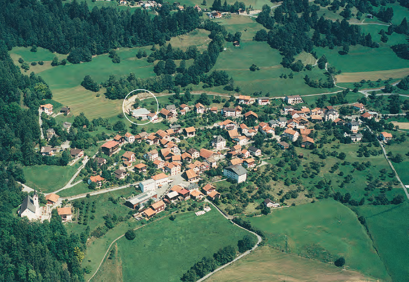
Abb. 2: Tomils, Sogn Murezi. Luftaufnahme von Tomils. Am oberen Dorfrand liegt die überdachte Ausgrabungsfläche Sogn Murezi (Kreis), am linken Bildrand ist die heutige Pfarrkirche St. Mariä Krönung zu erkennen. Blick nach Südosten.