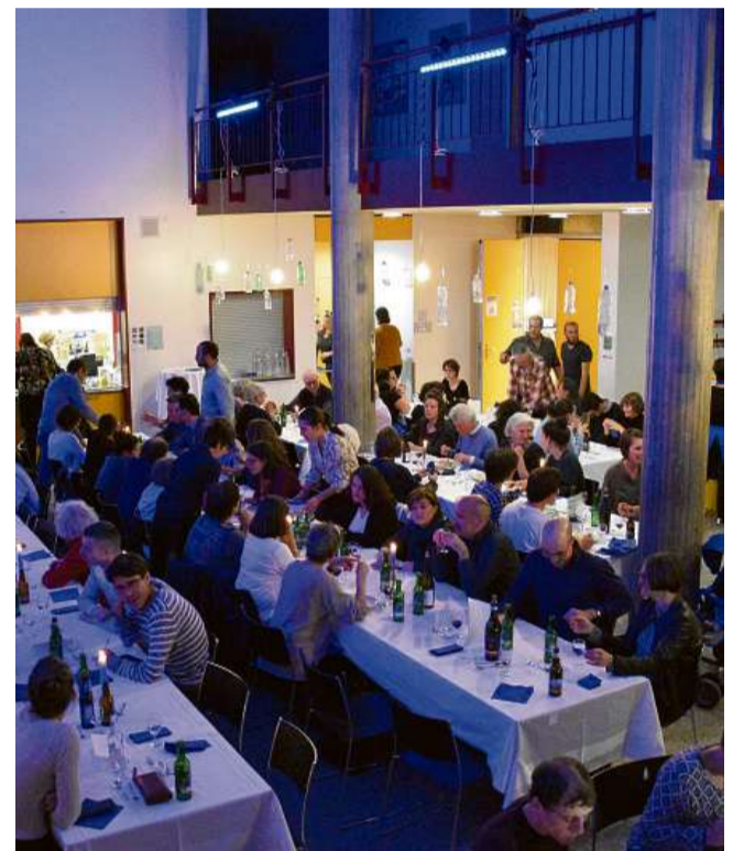
In program vast per ils Dis da litteratura 2021 – ma ina tschaina na datti nagina uonn.