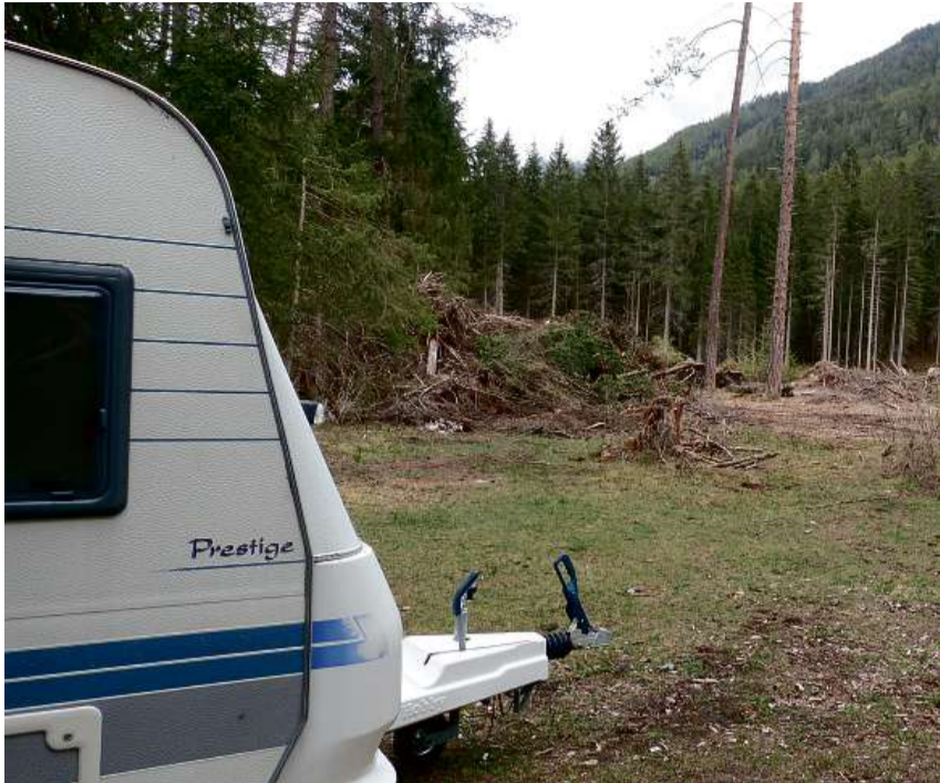
Ingio chi d'eira il parc da suas da Sur En es uossa ün grond clerai.