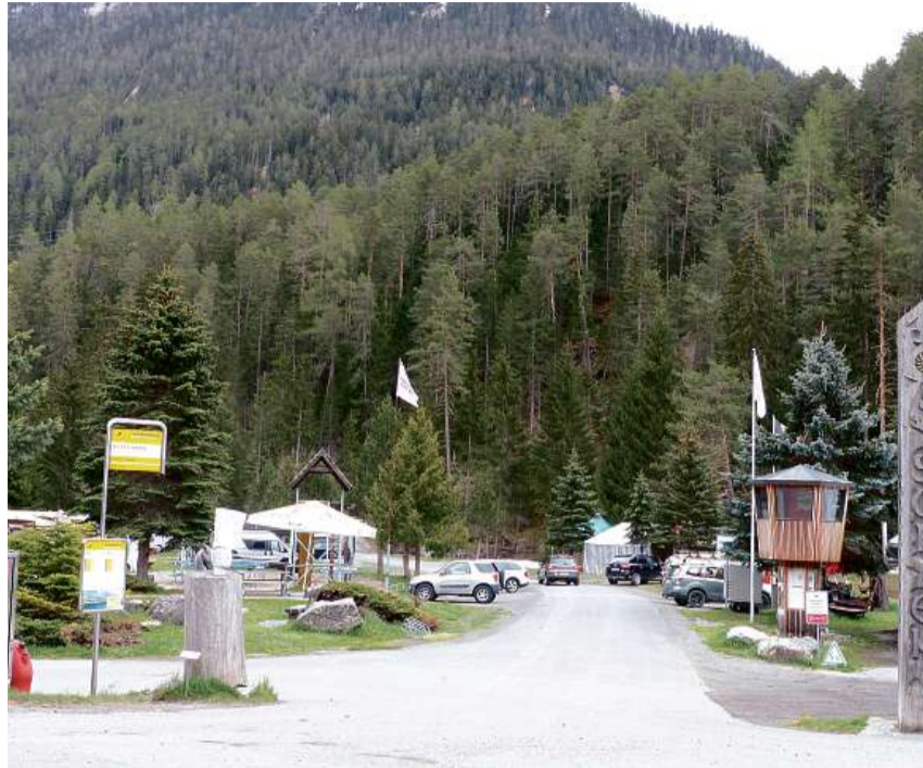
l' camping a Sur En da Sent esa fingià blera vita.