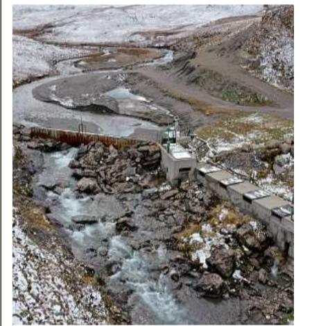
La cuntrada da palü Val Fenga po gnir revitalisada.

Il cuntrada da palü Val Fenga vegnan demontads ils edifizis ed ils stabiliments da l'Armada svizra. Quels servivan ils ultims decennis per proveder la chamonna Heidelberg dal Deutscher Alpenverein cun electricità. Tenor la descripiun e l'inventari es la Val Fenga üna da las cuntradas da palü las plü bellas in Svizra. La val otalpina es fich isolada e pervi da quai restada in ün stadi natural.