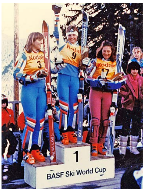
1985 gewann Erika Hess den Ski Word Cup in Savognin.