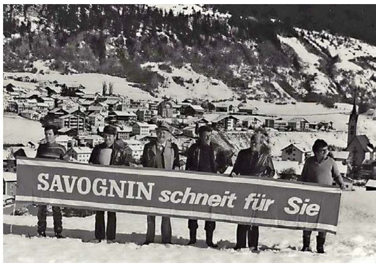
Dann war es soweit: Savognin schneite für Sie.