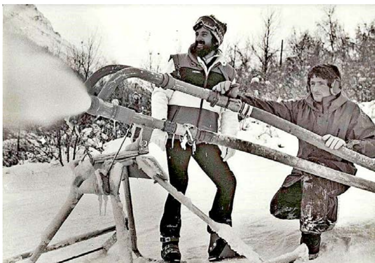
Feuertaufe der Grossschneeanlage 1978.