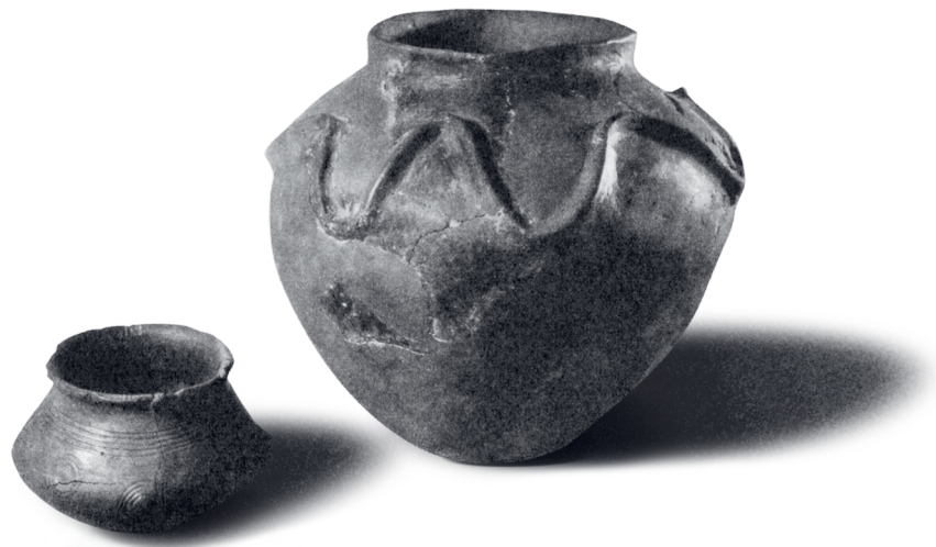
1938 entdeckte man in Crestaulta bei Surin (Lumbrein) zahlreiche Gefässe, Geräte und Scherben aus Stein, Holz und Bronze aus einer Siedlung der Bronzezeit. Auch diese Funde werden heute im Rätischen Museum aufbewahrt.