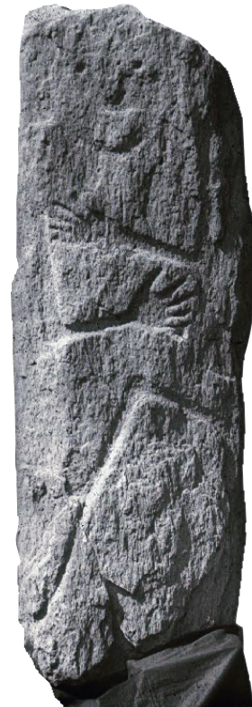
Die Stele von Sietschen (Lumbrein) stammt aus dem Neolithikum (zirka 3000 Jahre v. Chr.) wurde 1961 entdeckt und befindet sich heute im Rätischen Museum in Chur.

In konzertierter Form befassen wir uns mit der politischen Entwicklung von der Feudalzeit über die Demokratisierungsbestrebungen von der Gründung der Bünde über die Gerichtsgemeinden zu den Kreisen, und von den Pfarreien über die politischen Gemeinden und Bürgergemeinden bis zu den Fusionen am Anfang des 21. Jahrhunderts. Im Laufe der Geschichte wurden die politischen und kirchlichen Strukturen mehrmals verändert. Tendenzen zur Dezentralisierung und Zentralisierung stehen in stetem Wechsel. Über Jahrhunderte kämpften Kleinpfarreien um die sukzessive kirchliche Ablösung von der Talkirche Pleif, heute vereinen sie sich wieder. Wir befassen uns aber auch mit Hungersnöten, Armut, Krankheiten und Epidemien, Lawinen und Überschwemmungen, Schlachten und Unglücksfälle, die vielfach Leid und Trauer verursacht haben.