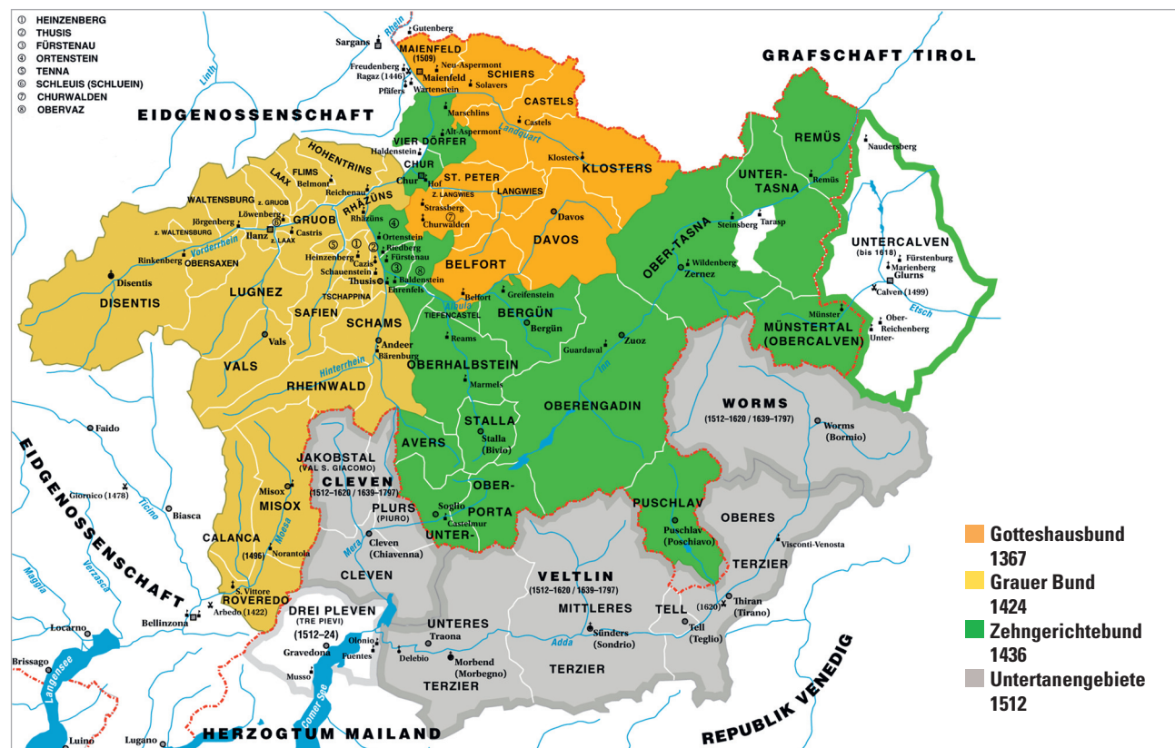
La carta dalla Republica dalle Treis Ligias Reticas entochen 1797.

Mit den «Ilanzer Artikeln» und mit dem Bundesbrief von 1524 legten die Drei Bünde den Grundstein für den heutigen Kanton Graubünden. In den Ilanzer Artikeln wurde der Einfluss des Bischofs stark beschnitten und die Dörfer konnten autonom entscheiden, ob sie beim katholischen Glauben bleiben oder den neuen reformierten Glauben annehmen wollten. Auch die Pfarrwahl blieb ihnen überlassen. Die «Ilanzer Artikel» dienten aber nicht nur dem konfessionellen Frieden in der Zeit der Reformation und Gegenreformation, sondern waren auch Ansporn für mehr politische und wirtschaftliche Unabhängigkeit