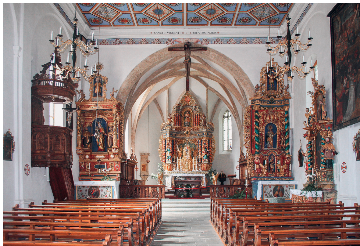
Die Kirche von Pleif (Vella) beherbergt Relikte aus verschiedenen Zeit- und Stilepochen: von der Karolingerzeit und Römerzeit, über Gotik und Barock bis zu Renaissance und Rokoko.