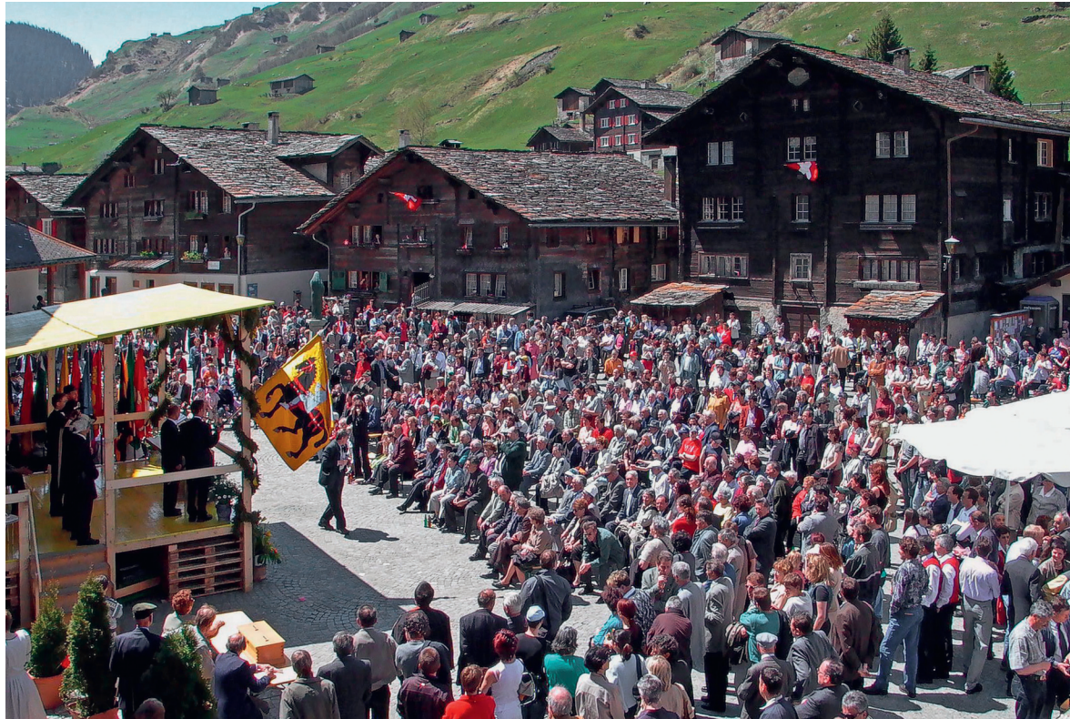
Erste Landsgemeinde des Kreises Lumnezia/Lugnez 1991 in Vals. 2016 wurden die Kreise definitiv abgeschafft.

das Betreibungs- und Konkursamt sowie das Vormundchaftswesen wurden der Region Surselva übertragen. Nachdem man den Kreisen schrittweise alle richterlichen und politischen Kompetenzen weggenommen hatte, wurden die Kreise 2016 definitiv abgeschafft. Gemäss Ämterstatistik stammten die