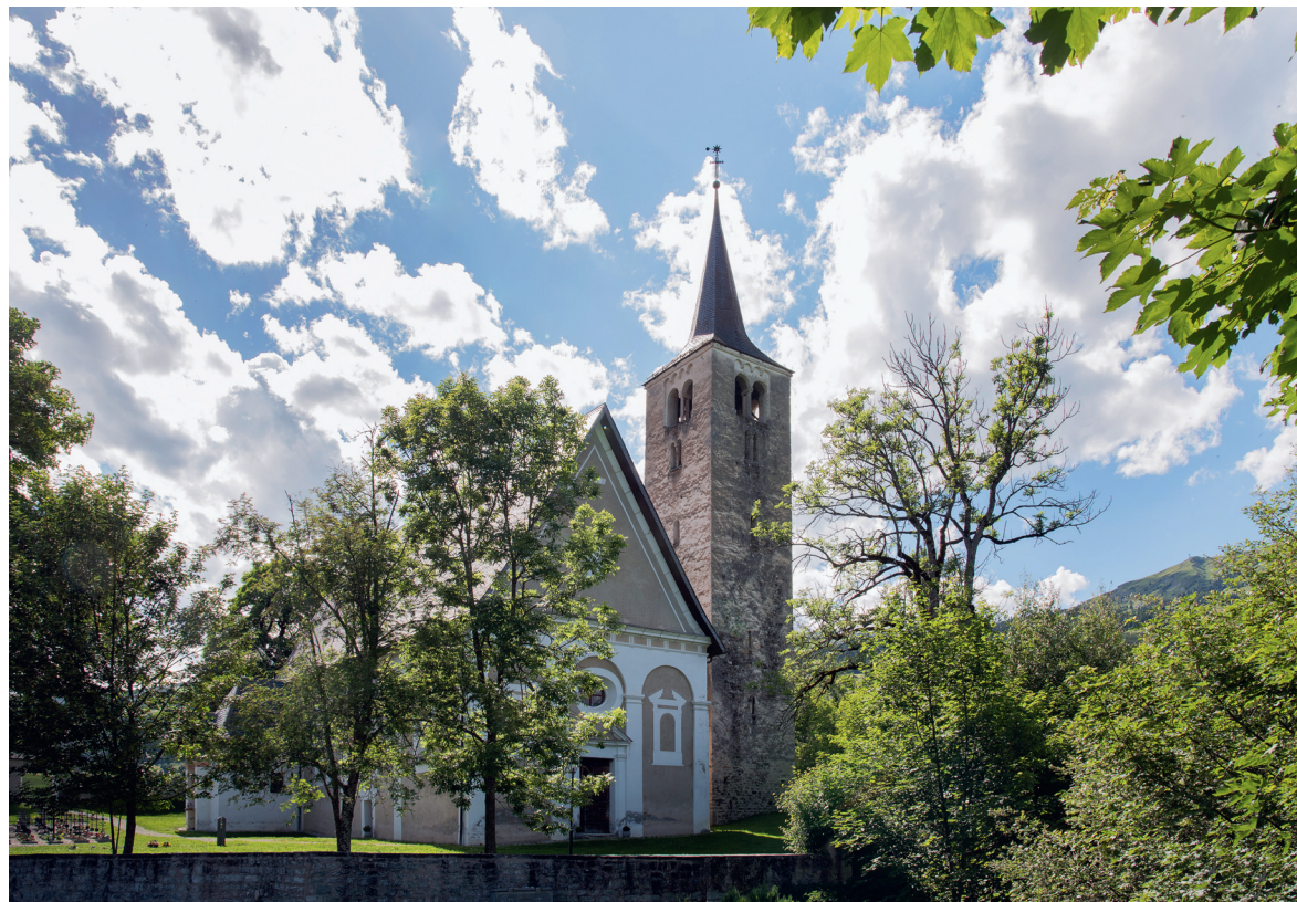
Die ehemalige Mutterkirche von Pleif in Vella. Sie wurde erstmals im karolingischen Reichsurbar um 840 n. Chr. als «ecclesia plebeia ad S.Vincentium» erwähnt.

Auf dem Gebiet der heutigen Gemeinde Lumnezia und der beiden Pfarreien gibt es nicht weniger als 33 Kirchen und Kapellen. Ferner gibt es etliche Bildstöcke und viele Kreuze, sei dies auf den Bergspitzen