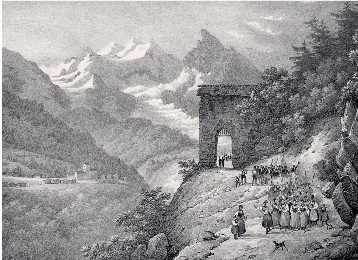
Das Frauentor Porclas: 1352 schlugen die tapferen Lugnezerinnen die Armee des Grafen von Werdenberg, die ins Lugnez eindringen wollte, in die Flucht. Ihre Männer besiegten den Gegner am Mundaun.