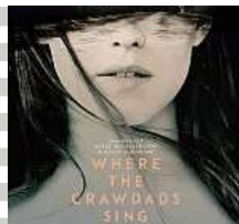
Freitag, 9. September, 20.30 Uhr KINO: WHERE THE CRAWDADS SING Romanverfilmung aus den US-Südstaaten USA 2022, E/df, 126 Min.

Donnerstag, 1. September – Sonntag, 4. September