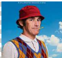
Freitag, 26. August, 20.30 Uhr KINO: THE PHANTOM OF THE OPEN Britische Feelgood-Komödie nach einer wahren Geschichte GB 2021, E/d, ab 12 J., 106 Min.