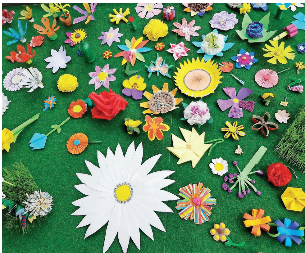
Die Rhäzünser Schülerschaft hat sich dem Thema Blumen gewidmet.

e. Die Schülerinnen und Schüler vom Kindergarten bis zur 6. Klasse der Schule Rhäzüns haben während der Zeit des Fernunterrichts in den Fächern Textiles, Technisches und Bildnerisches Gestalten den Auftrag erhalten, sich wöchentlich in der Natur die Blüte einer Blume genau anzuschauen und diese mit beliebigem Material, welches sie zu Hause finden, nachzugestalten. So ist über die Wochen ein richtiges Blütenmeer gewachsen. Dieses ist noch bis Montag, 11. Mai, im alten Feuerwehrlokal in Rhäzüns zu betrachten. Danach werden die Blumen ins Schulhaus gezügelt, wo sie bis zu den Sommerferien die Schülerinnen und Schüler erfreuen.