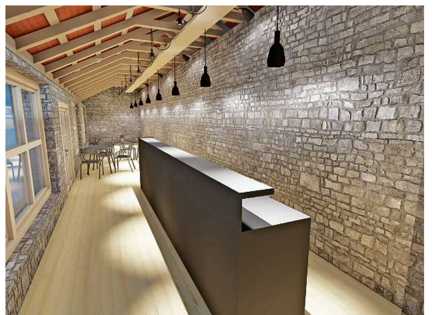
Visualisaziun dalla nova «BARgia» dil Museum Regional Surselva che ha aviert il venderdis suas protas.