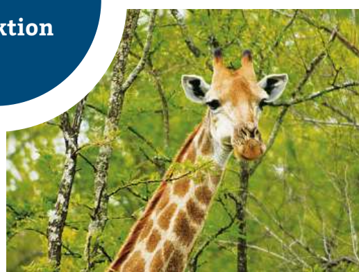
Bildnachweis: © -wv- (Giraffe/Elefant)