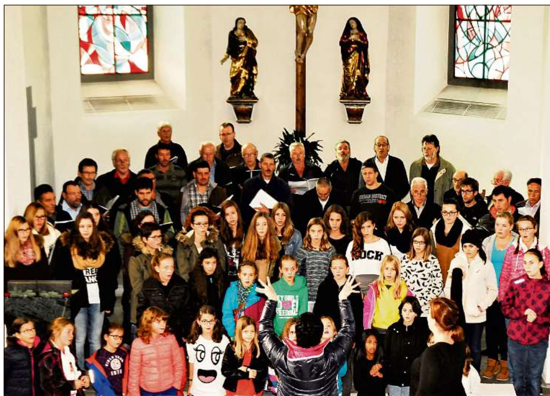
Ella baselgia parochiala han ils chors gronds plaz (cheu ina foto d'in concert digl onn vargau).

laian 31 valetar lur prestaziun. Denton era sil plaz-fontauna vegn ins a saver tedlar canzuns e chors. Nov d'els vegnan a sepresentar denter las 11.30 e las 16.30 cun produczziuns libras. Sil pli tard allas 18.15 vegn la zona da silenzi ad esser transferida definitiv el «Vitget da cant». Leu sepresentan lu durent 45 minutas ils chors d'affons Surselva e Sumvitg. Bunahein 100 affons vegnan a presentar tocs dil repertori ch'els han era cantau al festival SKJF a Lugano. Suenter quei punct culminont suonda in auter. Allas 19.00 ei igl act festic cun produczziuns dalla Societad da musica da Falera, las canzuns generalas, la cuorta commemoraziun «150 onns DCS», il rapport dil cau-expert e la publicaziun dils predicats.