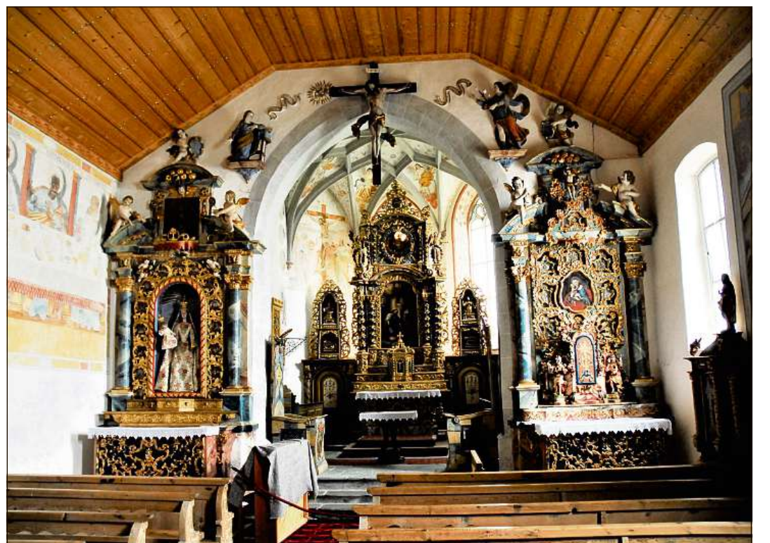
La baselgia da s. Rumetg ei sonda proxima in dils centers neuralgics: Cheu sepresentan 15 chors «pigns» avon ils experts.