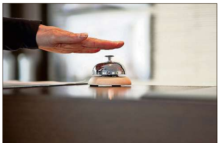
Il dumber da pernottaziuns è creschi il schaner per 50 000 cumpareglià cun las cifras da l'onn avant.

Germania e da l'Italia èn las pernottaziuns idas enavos per 2,7% reu. S'augmentadas fermamain èn las pernottaziuns dad Ollandais e da Beltgs (in terz dapli). Tar ils Chinois èn las pernottaziuns s'augmentadas il pli ferm, per 111,5%. En l'entira Svizra ha l'hotellaria nudà totalmain 2,7 milliuns pernottaziuns. Cumpareglià cun la medema perioda da l'onn avant è quai in plus da 5,2%. En tut sajan 1,4 milliuns pernottaziuns da persunas da l'exteriur, quai è in plus da 4,8%. Ils giasts svizzers han augmentà las pernottaziuns per 5,5%.