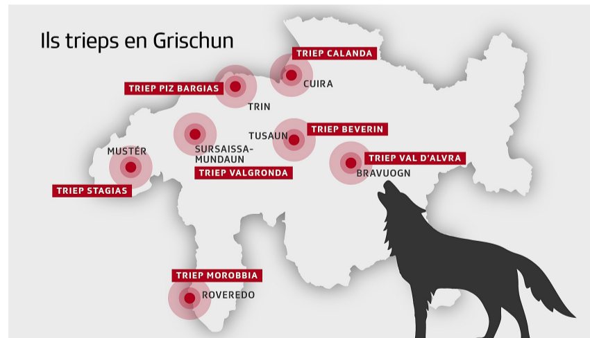
Ils trieps da lufs en il Grischun.